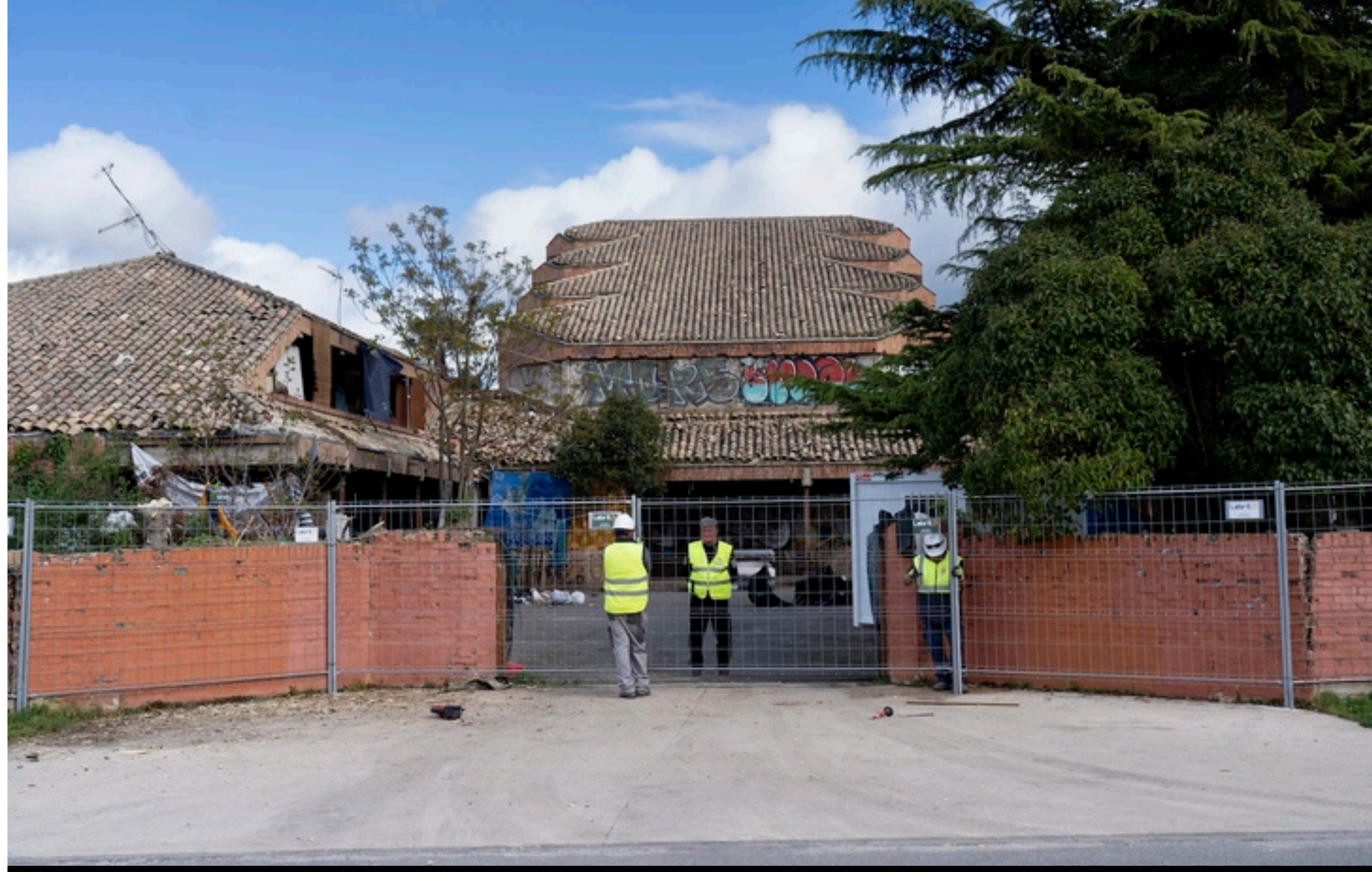
Operarios vallan el convento de Agustinas tras del desalojo.

El Ayuntamiento de Iruñea ha solicitado a través de una carta una reunión para abordar el sinhogarismo. La carta ha sido remitida al Gobierno de Nafarroa, a la Federación Navarra de Municipios y Concejos (FNMC), a los ayuntamientos de Iruñerria y a los de las cabezas de merindad. La fecha propuesta para el encuentro es este mismo viernes.